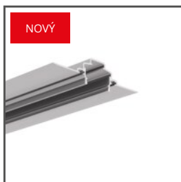
FASKO A04323 Ref. arch C4323